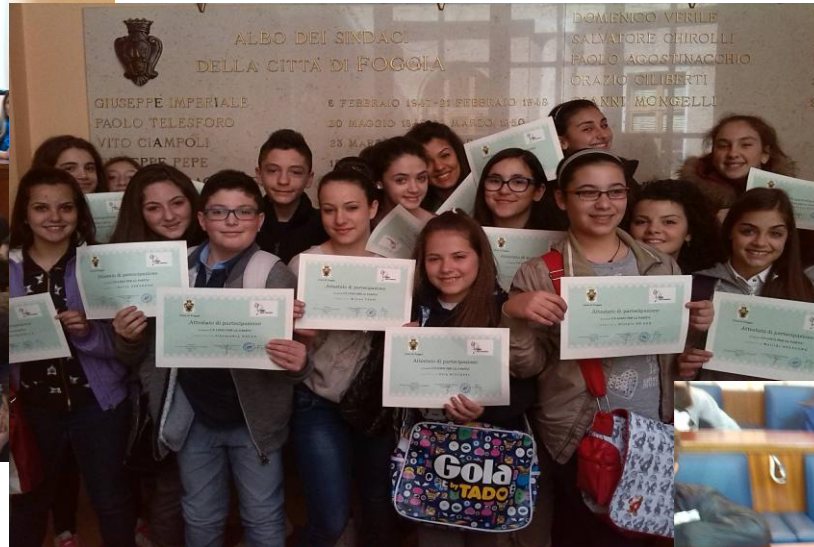
La II L alla premiazione del Concorso