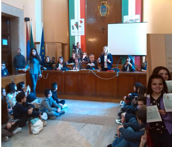
La premiazione del Concorso "Un logo per la parità".