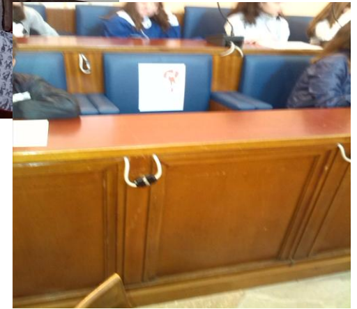
Una poltrona dedicata a tutte le donne vittime della violenza degli uomini.