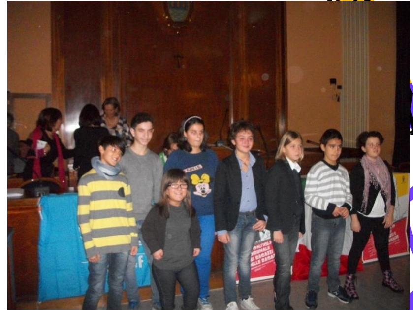
Morena e i candidati sindaco